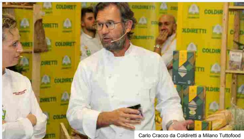
Carlo Cracco da Coldiretti a Milano Tuttofood