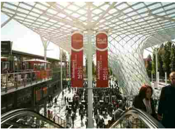
Tuttofood in Fiera Milano

L'Ad: "Un'occasione per dare nostro contributo anche al cambiamento dei comportamenti alimentari"