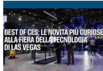
Best of CES: le novità più curiose alla fiera tech di Las Vegas

Dal punto di vista dei numeri, come detto, quest’anno la manifestazione punta ai numeri pre-Covid e, in particolare, a quattro mesi dal taglio del nastro sono già con lista d’attesa i settori Tuttogrocery, Tuttoseafood e Tuttofrozen con la partecipazione di tutti i grandi nomi del settore, fanno sapere da Fiera Milano . Sul fronte della sostenibilità e della lotta allo spreco, tornerà poi anche l’iniziativa Tuttogood in collaborazione con Banco Alimentare e altre realtà del Terzo Settore, tra le quali Pane Quotidiano, che negli anni ha permesso di recuperare tonnellate di alimenti utilizzabili al termine delle giornate di manifestazione.