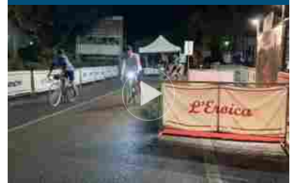
Bici storiche, L'Eroica fa tappa al Parlamento Europeo