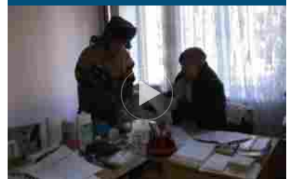
La dottoressa che visita in pazienti a Bakhmut sotto le bombe