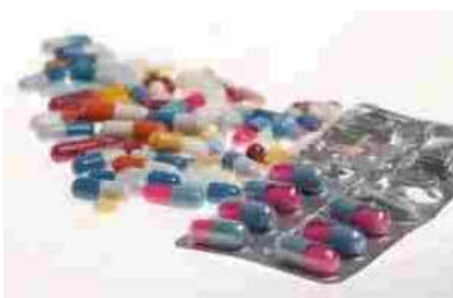
Assogenerici cambia nome e avvia nuova fase per industria farmaceutica