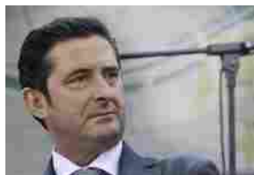
Covid, Fipe: da Spadafora dichiarazioni prive di fondamento