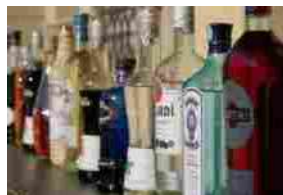
Cocktail Mastery, il corso online gratuito per creare cocktail come un ...