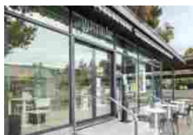
Gooods: il convenience store di Migrolino (Migros)