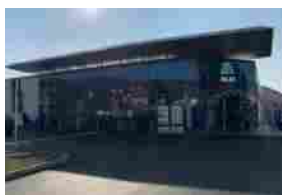
Aldi promuove ricerca e prevenzione