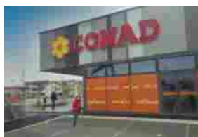
CIA-Conad: le attività per consolidare e ampliare la rete