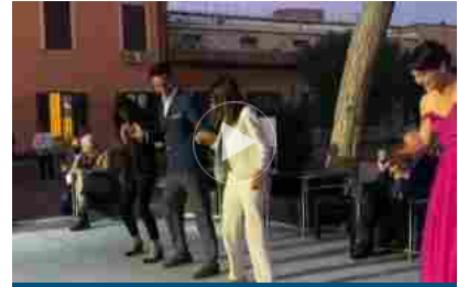
Virginia Raggi balla con Samuel Peron e la ministra Dadone

Roma, 7 giu. (askanews) – Michele Merlo non ce l'ha fatta. L'ex concorrente di X Factor e di Amici, ricoverato nel reparto di terapia intensiva dell'Ospedale Maggiore di Bologna è deceduto dopo essere stato colpito da una leucemia fulminante, malattia che non sapeva di avere. Nella notte tra... (askanews.it)