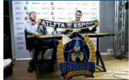
La competizione tra sport e gaming di qualità con Atleta esport