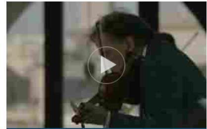
Torna il Rome Chamber Music Festival: concerti tra Roma e Firenze

“L’agroalimentare e l’arredamento rappresentano due autentici portabandiera della qualità italiana nel mondo, e l’evento di oggi dimostra che è possibile unire settori diversi accomunati da esigenze simili di proiezione verso mercati stranieri – dichiara Manlio Di Stefano, sottosegretario al ministero degli Affari Esteri – Si tratta di quello spirito di squadra che, come governo e come Farnesina, cerchiamo sempre di incoraggiare, e proprio per questo è una soddisfazione poter vedere una sinergia concreta da tempo auspicata in tutto il settore fieristico. Alla Farnesina siamo sempre in prima linea per internazionalizzare i nostri settori produttivi, a partire da quello fieristico, vero e proprio volano della nostra economia esportatrice e vetrina delle nostre eccellenze”.