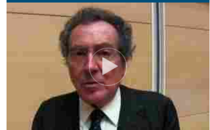
Gros-Pietro: Intesa investe su futuro di innovazione e ambiente