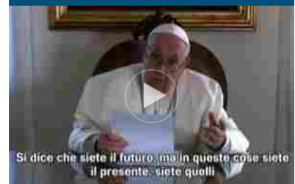
Clima, il Papa ai giovani: “Sapete mandare in crisi gli adulti”