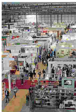
Un padiglione di Tuttofood

● Due gli appuntamenti che attendono il Consorzio Piacenza Alimentare: Tuttofood Milano , la manifestazione business to business globale e innovativa dell'ecosistema agroalimentare, diventata punto di riferimento nazionale ed internazionale, si terrà dal 22 al 26 ottobre 2021 nel polo espositivo di Fiera Milano Rho . Il Salone Biennale dell'Alimentazione, del Dolciario, del Prodotto Biologico,