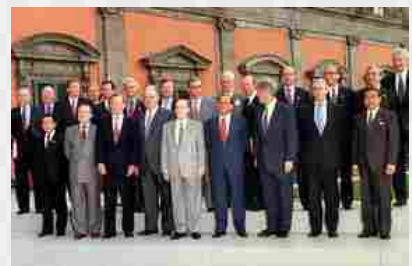
De Luca, 50 anni storia per capire impegno

Libro fotografico con l'ANSA racconta mezzo secolo dalla nascita dell'ente