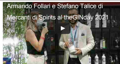
altri video su beverfood.com Channel