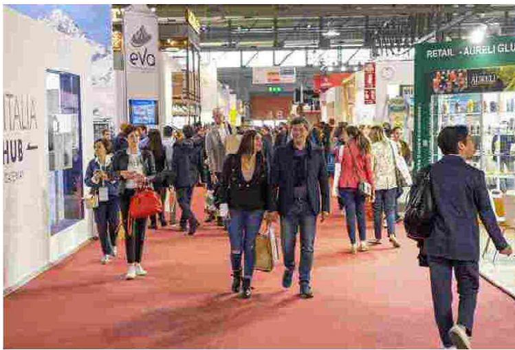
Venerdì 19 Marzo 2021