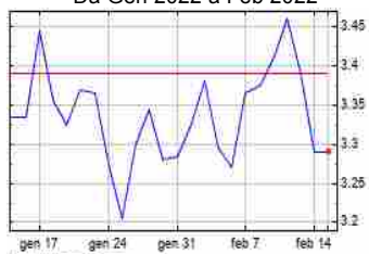
Grafico Azioni Fiera Milano (BIT:FM)