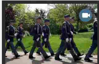
10 MAGGIO, 14:16

MELONI A PRAGA PER IL BILATERALE CON IL PRIMO MINISTRO FIALA